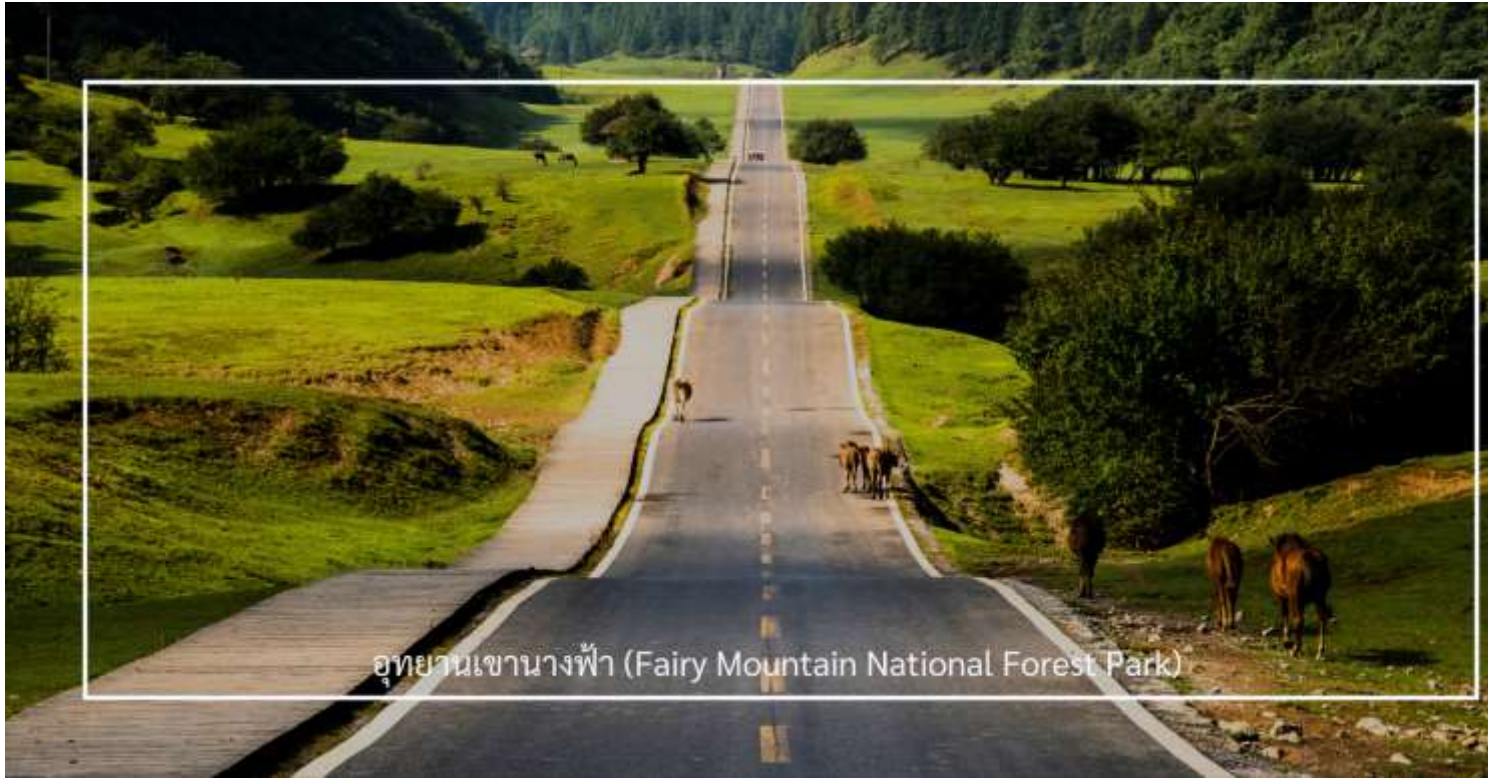
อุทยานเขานางฟ้า (Fairy Mountain National Forest Park)

โดดเด่นด้วยภูมิประเทศแบบที่ราบสูงอัลไพน์ ครอบคลุมพื้นที่กว่า 330 ตารางกิโลเมตร มีความสูงเฉลี่ยกว่า 2,000 เมตรจากระดับน้ำทะเล อุดมสมบูรณ์ไปด้วยทุ่งหญ้ากว้าง ป่าไม้เขียวขจี และยอดเขาสลับซับซ้อน งดงามราวภาพวาด พร้อมอากาศเย็นสบายตลอดทั้งปี นักท่องเที่ยวสามารถนั่ง รถไฟขบวนเล็ก ชมวิวธรรมชาติรอบอุทยานฯ ได้อย่างสะดวกสบาย เพลิดเพลินทั้งฤดูร้อนที่สดชื่นและฤดูหนาวที่ปกคลุมด้วยหิมะขาวโพลน