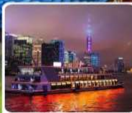
ส่องเรือแม่น้ำหวงผู่