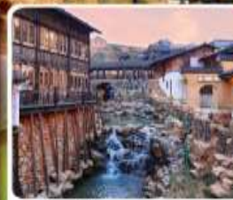
เมืองโบราณเหย้าหู