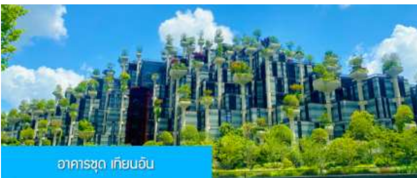
อาคารชุด เทียนอัน