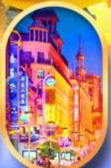
ถนนหนานกิง