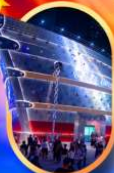
เรือคอะหลุยส์