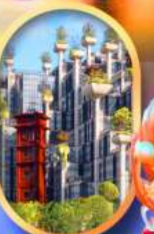
อาคาร 1,000 คับไม้