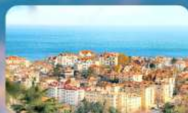
จุดชมวิว Signal Hill Park