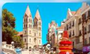
โบสถ์เซนต์โมเคิล