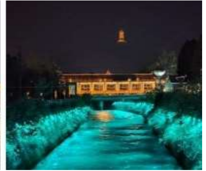
เขื่อนตูเจียงเยี่ยน

ที่พัก LIWAN HOLIDAY HOTEL DUJIANGYAN หรือเทียบเท่า 4 ดาวจีน