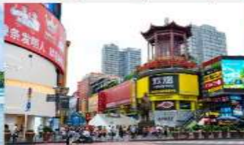
ถนนหวงซิงลู่