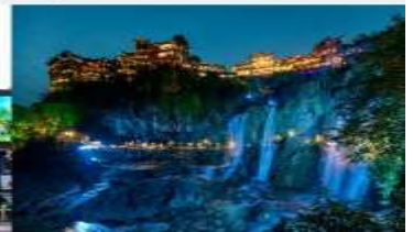
ฟูหรงเจิน

*ทางบริษัทฯ ขอสงวนสิทธิ์ในการสลับโปรแกรมทัวร์ตามความเหมาะสมขึ้นอยู่กับสถานการณ์หน้างาน โดยคำนึงถึงผลประโยชน์ของลูกค้าเป็นสำคัญ