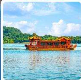
ล่องเรือทะเลสาบหลิวยวู่