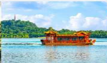
ล่องเรือทะเลสาบหลิวเยว่หู