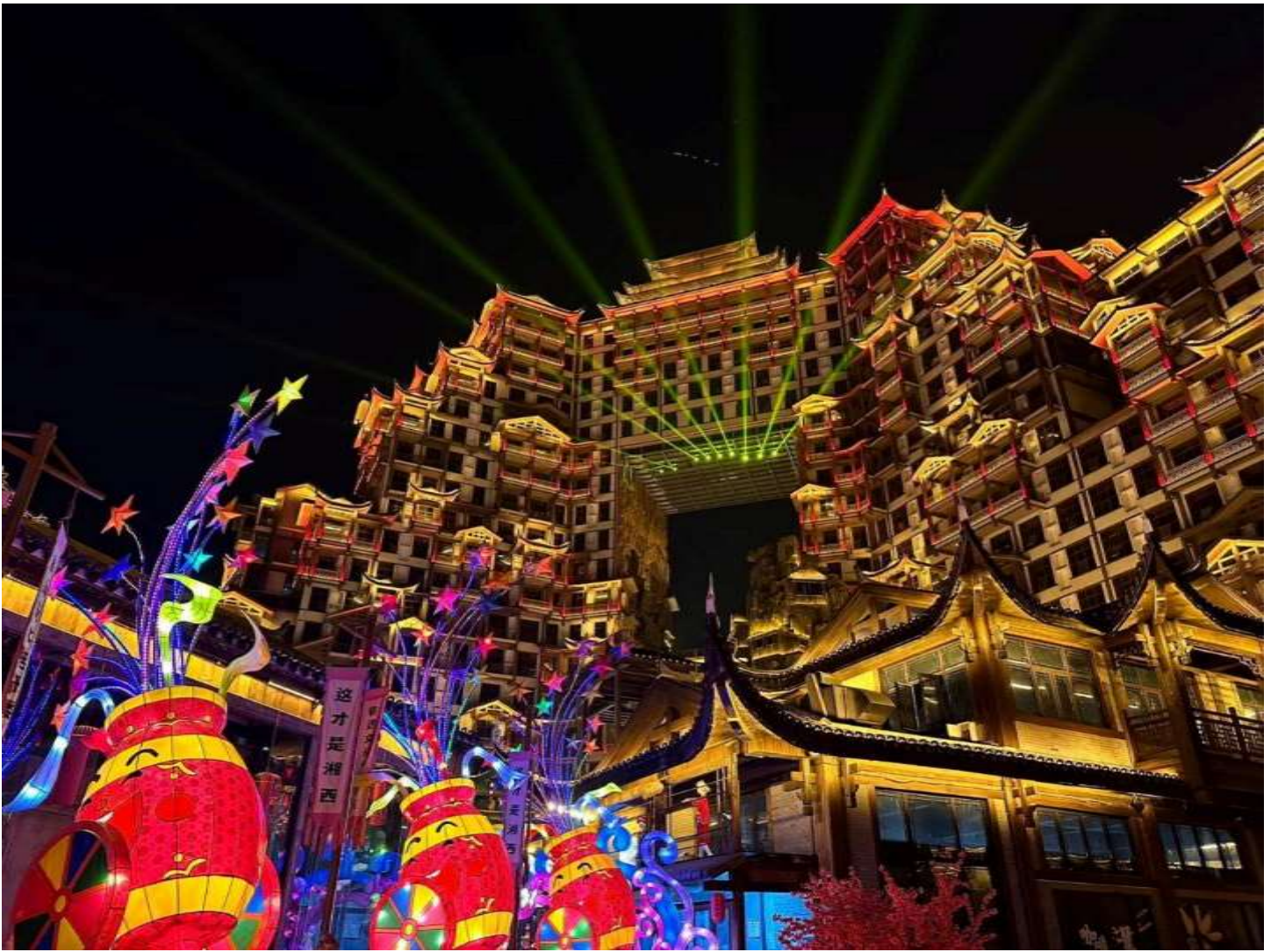
ที่พัก MELLOW CRYSTAL HOTEL โรงแรมระดับ 4 ดาว หรือเทียบเท่า