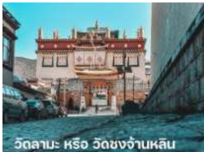
วัดลามะ หรือ วัดชงจ้านหลิน

นำท่านชม วัดลามะ หรือ วัดชงจ้านหลิน (รวมรถอุทยาน บริการรับ-ส่ง จุดจอดรถอุทยานไปส่งยังจุดทางเดินขึ้นวัดลามะ) สร้างขึ้นในสมัยราชวงศ์ซิง มีพระลามะจำพรรษาอยู่มากกว่า 700 รูป วัดแห่งนี้ห่างจากเมืองจางเตี้ยนไปทางเหนือประมาณ 5 กิโลเมตร มีการสร้างในลักษณะจำลองแบบจากพระราชวังโปตาลา (Potala) ในกรุงลาซา (Lhasa) และนอกจากนี้ยังเป็นวัดนิกายลามะแบบธิเบตที่ใหญ่ที่สุดในมณฑลยูนนานซึ่งมี อายุที่เก่าแก่กว่า 300ปี และในช่วงเทศกาล ชาวทิเบตส่วนใหญ่ ก็จะนิยมการเต้นระบำหน้ากากและเป่าแตรงอนซึ่งเป็นการละเล่นที่อยู่ ในช่วง เทศกาล สำคัญต่างๆของวัด รวมถึงประเพณีต่างๆ ที่ชาวทิเบตได้อนุรักษ์ไว้ ณ วัดชงซานหลินแห่งนี้ นำท่านเดินทางสู่ ลี่เจียง เป็นเมืองที่ตั้งอยู่ทางตะวันตกเฉียงเหนือของมณฑลยูนนาน ประเทศจีน ลี่เจียงเป็นเมืองโบราณสวยงามและมีประวัติศาสตร์ยาวนานกว่า 800 ปี จึงได้รับขึ้นทะเบียนเป็นมรดกโลกจากองค์การยูเนสโก (UNESCO) เมื่อปี ค.ศ. 1977 ให้เป็นมรดกโลกทางวัฒนธรรม