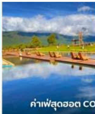
ค่าเฟ่สุดฮอต COFFEE YUN DI AN