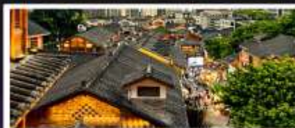
เมืองโบราณสี่ปาที้