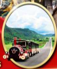
อุทยานเขานางฟ้า