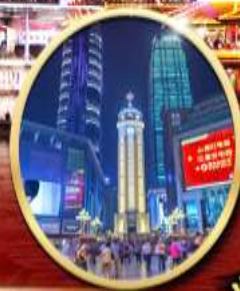
ถนนคนเดินเจียฟางเป่ย์