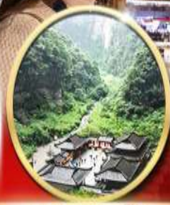
อุทยานหลุมฟ้า สะพาน สวรรค์