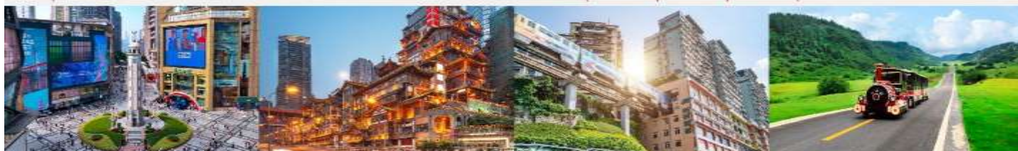
ถนนเจี่ยฟางเป่ย์