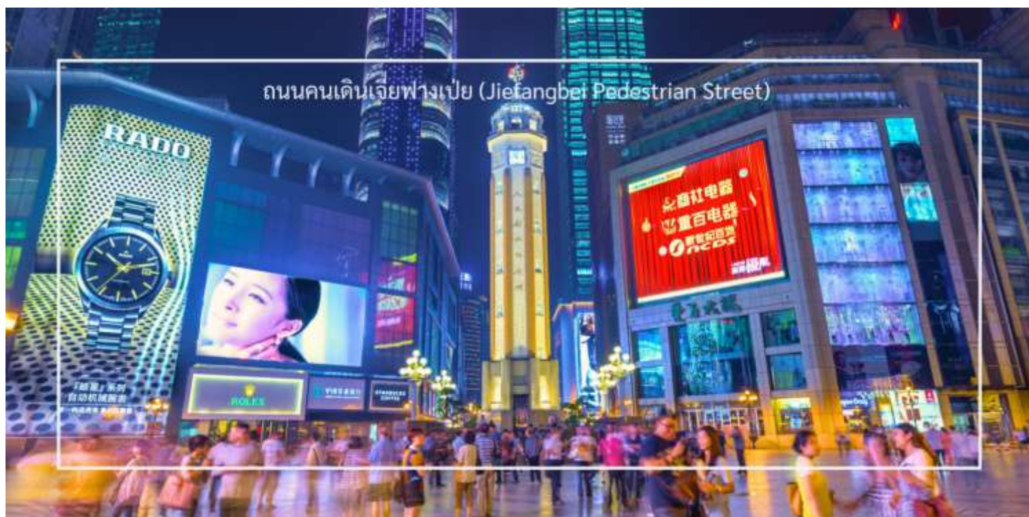
ถนนคนเดินเจี๋ยฟางเป่ย์ (Jiefangbei Pedestrian Street)

สมควรแก่เวลา นำท่านสู่ ถนนคนเดินเจี๋ยฟางเป่ย์ (Jiefangbei Pedestrian Street) เป็นหนึ่งในแหล่งช้อปปิ้งและท่องเที่ยวที่สำคัญที่สุดในเมืองฉงชิ่ง (Chongqing) เป็นพื้นที่ที่มีชีวิตชีวาและคึกคัก มีร้านค้า ร้านอาหาร และสถานบันเทิงมากมาย ถนนนี้ตั้งอยู่ใกล้กับสถานที่ท่องเที่ยวสำคัญอื่นๆ เช่น มหาศาลาประชาชนแห่งเมืองฉงชิ่ง ทำให้สามารถเดินเที่ยวชมได้อย่างสะดวก ถนนสายนี้มีบรรยากาศที่มีชีวิตชีวา โดยเฉพาะในช่วงเย็นที่มีแสงไฟและการแสดงต่างๆ ที่ทำให้บรรยากาศน่าสนใจยิ่งขึ้น และยังเต็มไปด้วยร้านค้าแบรนด์เนม ร้านค้าท้องถิ่น และตลาดที่ขายสินค้าต่างๆ เช่น เสื้อผ้า เครื่องประดับ และของที่ระลึก ท่านสามารถแวะซื้อร้านดัง “POPMART” ร้านดังจากจีน ที่รวมพิกเกอร์ดีไซน์เก๋และตุ๊กตาน่ารักหลากหลายซีรีส์ยอดนิยม เช่น Molly, Dimoo, Labubu และอีกมากมาย ที่สายสะสมของเล่นไม่ควรพลาด