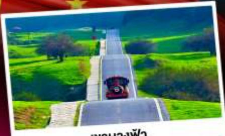
เขานางฟ้า

อุทยานหลุมฟ้าสามสะพานสวรรค์ มรดกโลกเขานางฟ้า ซุปบึงถนแดนแดน