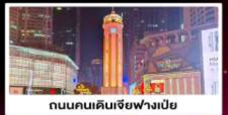
ถนนคนเดินเจี๋ยฟางเป่ย์