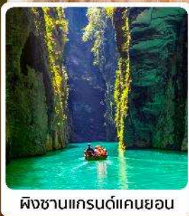
ผิงซานแกรนด์แคนยอน