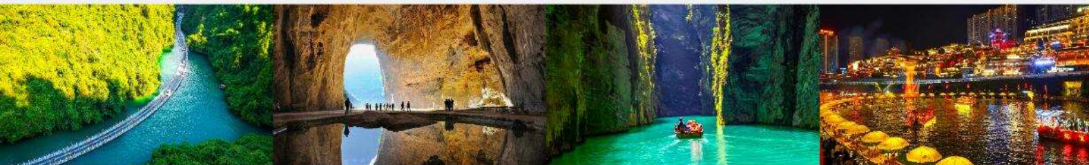
หุบเขาสิงโต