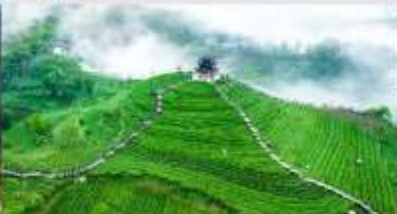
ไร้ชาอู่เจียโต