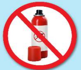
ขวดน้ำยา ฆ่าแมลง