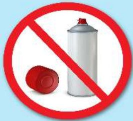
กระป๋องสเปรย์