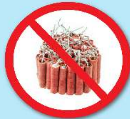
พลุ, ประทัด