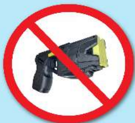
ปืนซ็อตไฟฟ้า