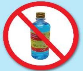
ขวดแอลกอฮอล์