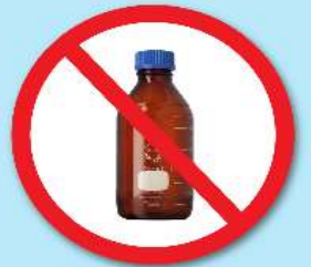
ขวดสารเคมี