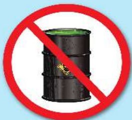
สารกัมมันตรังสี