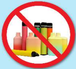
ปืนไฟฟ้า บุหรี่ยาสูบ