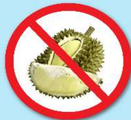
ผลไม้เขตร้อน ที่มีหนาม