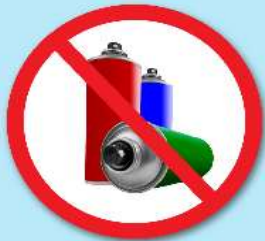
ขวดสเปรย์