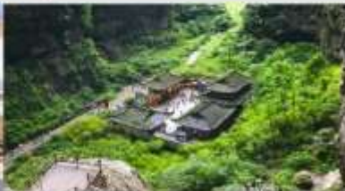
อุทยานแห่งชาติบ่อหลุมฟ้า

*ทางบริษัทฯ ขอสงวนสิทธิ์ในการล้บโปรแกรมทัวร์ตามความเหมาะสมขึ้นอยู่กับสถานการณ์หน้างาน โดยค่านั่งถึงผลประโยชน์ของลูกค้เป็นสำคัญ