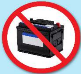
แบตเตอรี่ดำ