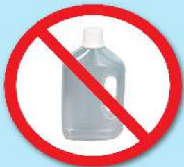
ขวดน้ำยา