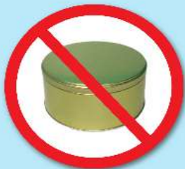
กล่องโลหะ