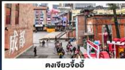
ตงเจียวจื่ออี้