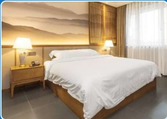
👤 SINGLE (SGL)