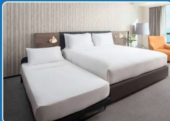
👤👤+👤 TRIPLE (TRP)

**รูปภาพห้องพักเป็นเพียงภาพสื่อถึงประเภทของเตียงเท่านั้น ไม่ใช่ภาพห้องพักจริงสำหรับการเข้าพัก**