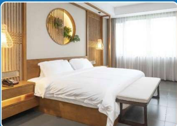
👤👤 DOUBLE (DBL)