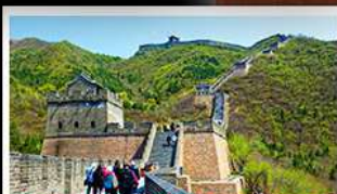
กำแพงเมืองจีนด้านจวียงกวน