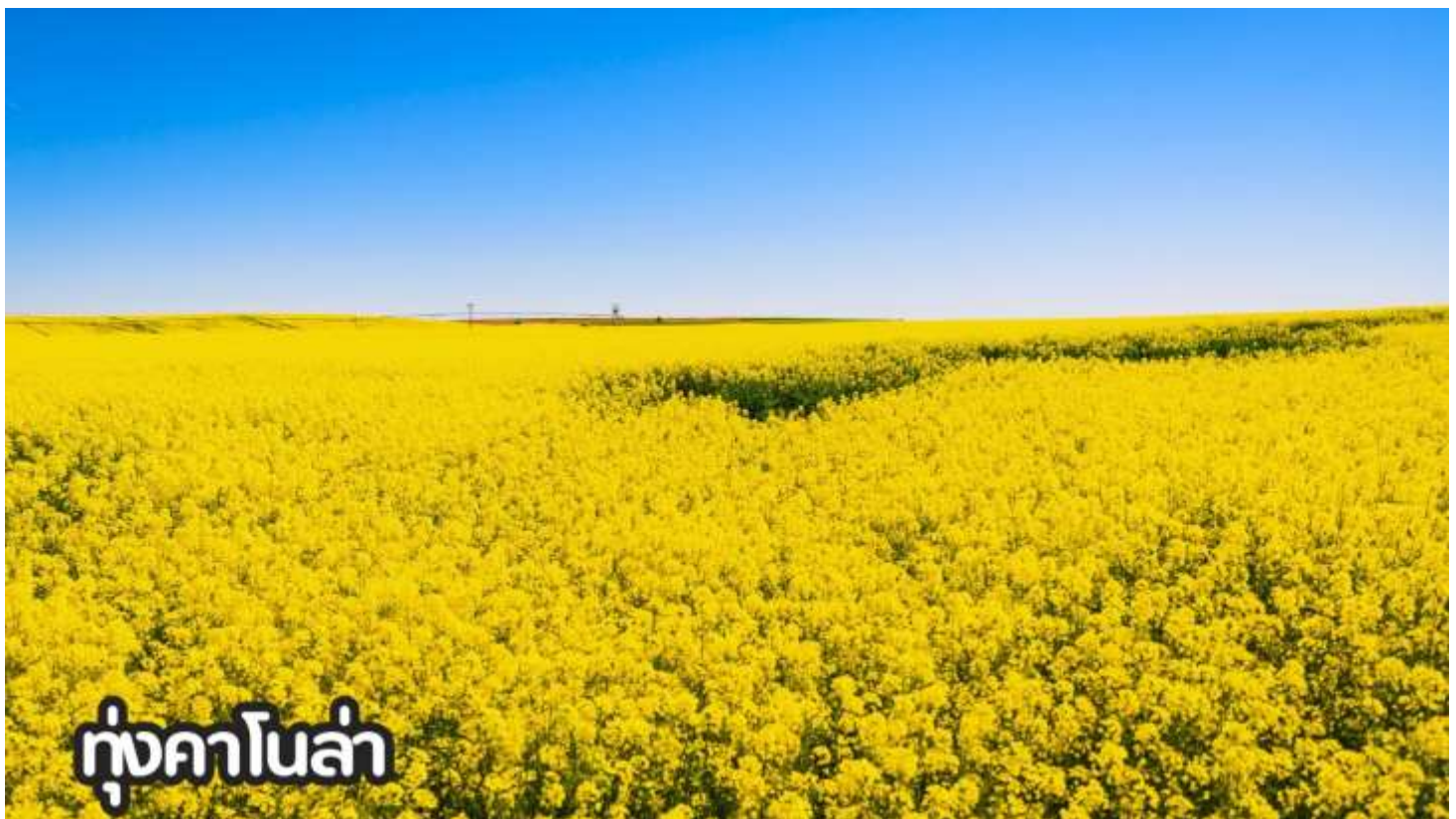
ทุ่งคาโนล่า

ที่พัก Holiday Inn Express หรือเทียบเท่าระดับ 4 ดาวจีน