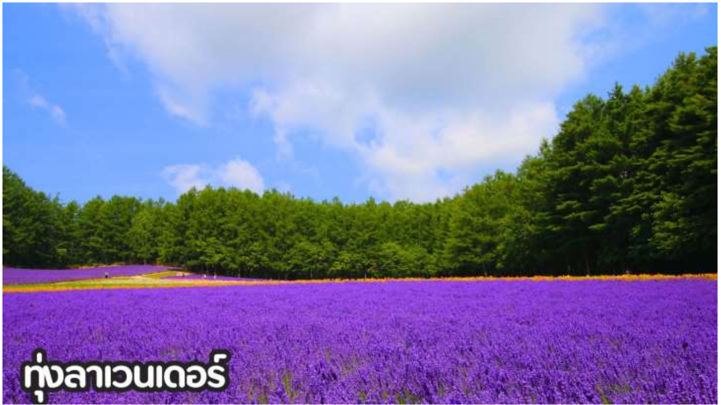
ทุ่งลาเวนเดอร์