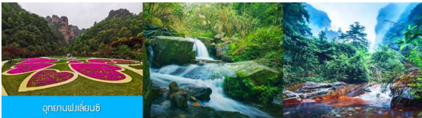
อุทยานฟงเลียนซี