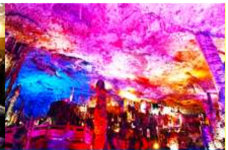
ถ้าเก้าสวรรค์จิวเทียนถัว