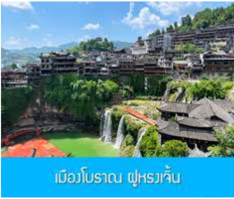
เมืองโบราณ ฝูหรงเจี้ยน