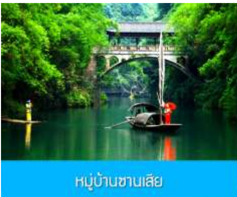
หมู่บ้านซานเสี