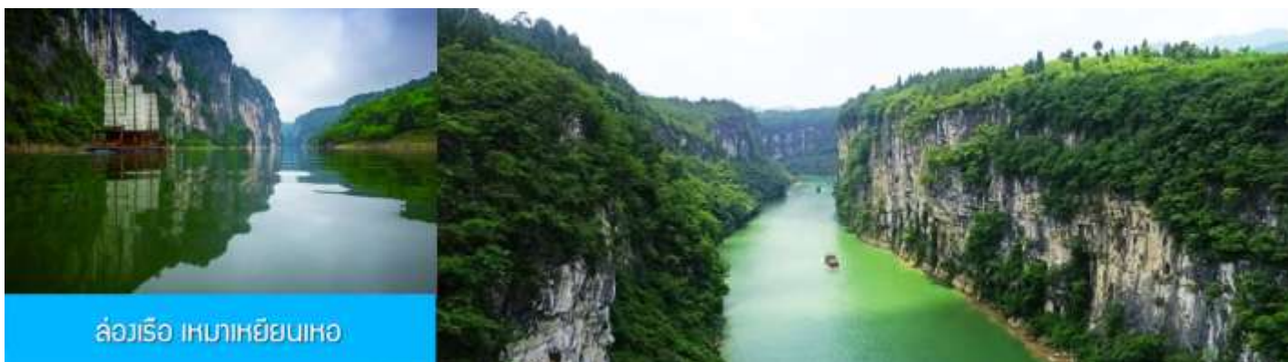
ล่องเรือ เหมาเหยียนเหอ