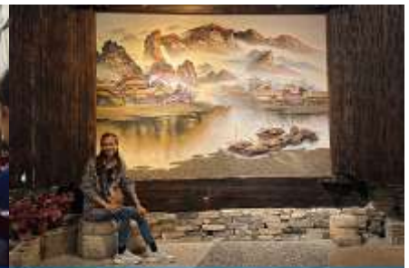
พิพิธภัณฑ์ภาพเขียนหินทราย