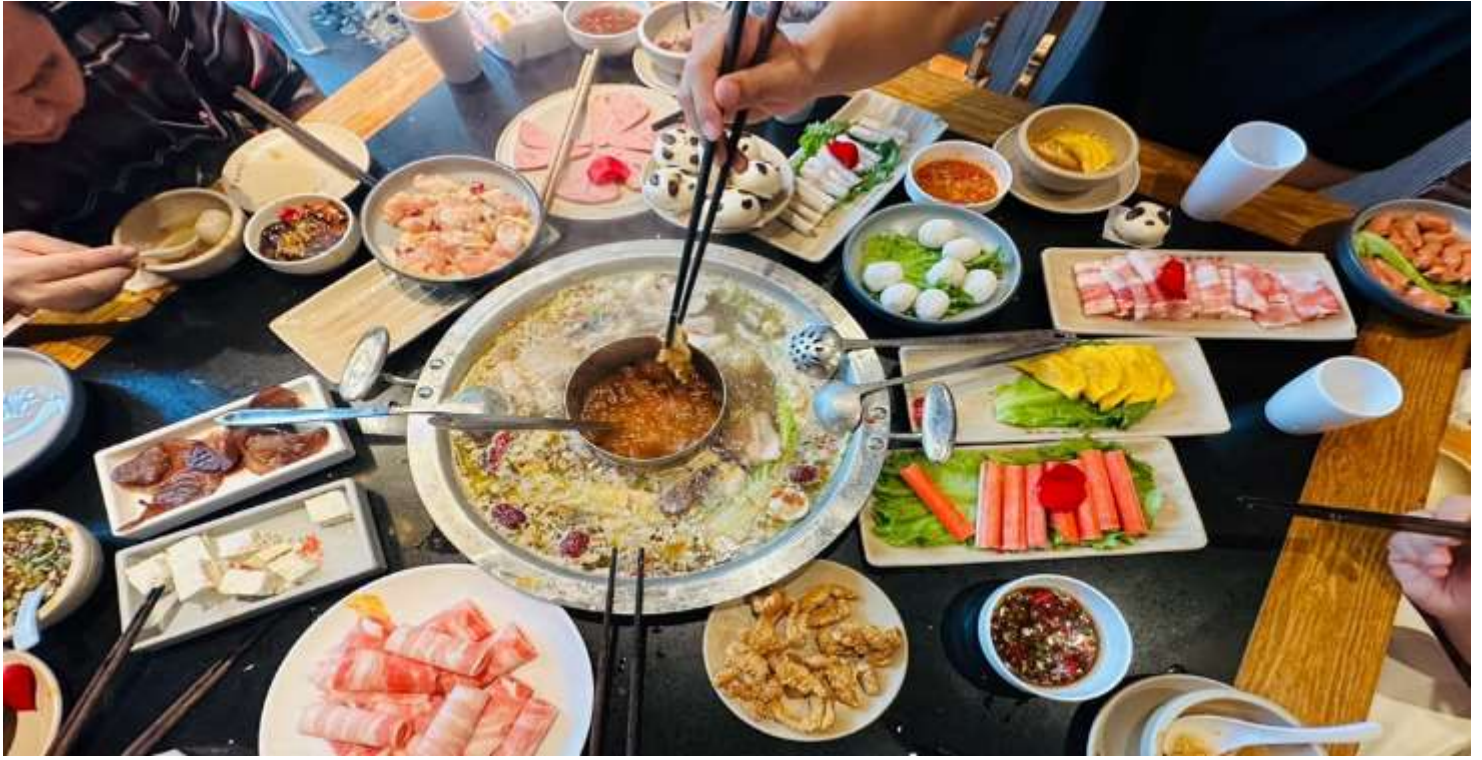
คำ รับประทานอาหารคำ ณ ภัตตาคาร (เมื่อที่ 12) *เมนูพิเศษสุกี้หมाल่าเสฉวน