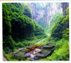
หลุมฟ้าสะพานสวรรค์