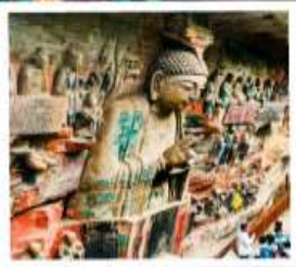
ฉาหินแกะสลักต้าจู้