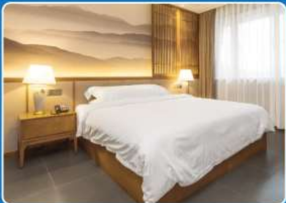
👤 SINGLE (SGL)