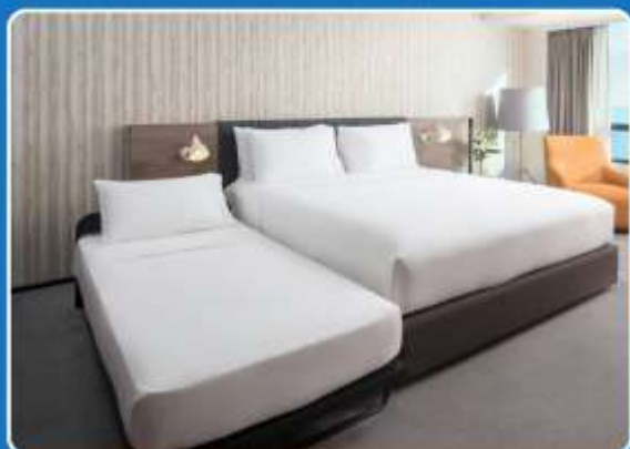
👤👤+👤 TRIPLE (TRP)

**รูปภาพห้องพักเป็นเพียงภาพสื่อถึงประเภทของเตียงเท่านั้น ไม่ใช่ภาพห้องพักจริงสำหรับการเข้าพัก**