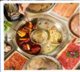
หม้อไฟหมาล่า