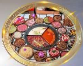
บุฟเฟต์ค่ำเนื้อไฟแรงยิ่ง