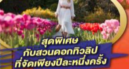
สุดพิเศษ กับสวนดอกทิวลิป ที่จัดเพียงปีละหนึ่งครั้ง