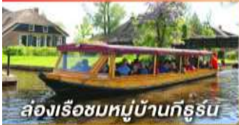
ล่องเรือชมหมู่บ้านกังหัน