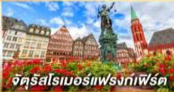
จัตุรัสโรเมอร์แห่งทไฟร์ต